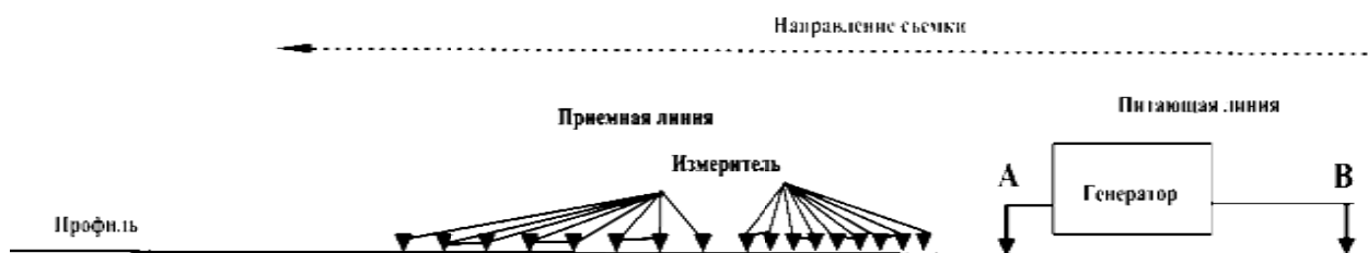
Рисунок 1 – Схема системы генератор-приемник

Замеры на приемной линии производились с чередованием: каждые 50 метров на 8-ми 50-метровых диполях и каждые 100 метров на 16-ти диполях. Схема взаимного расположения питающей и приемной линий показана на рисунке 1.