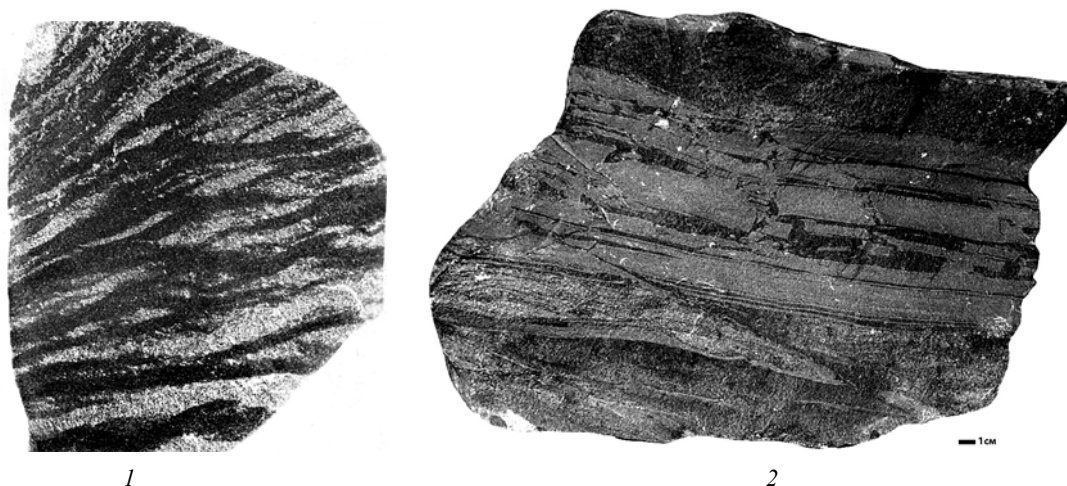
Рисунок 5 – Примеры инъекционных структур: 1 – струйчатые текстуры: струи борнита (темное) пересекают песчаник с галенитовым оруденением. Полированный шлиф – натуральная величина; 2 – фрагмент рудного пласта

Ею выявлены и детально исследованы редкие минеральные разновидности: «аномальный» (железистый) борнит, кубический халькопирит, джарлеит, ртутное серебро, конгсбергит, кутинаит и относительно редко встречающиеся в рудах Жезказгана – бетехтинит, никелистый кобальтин, джезказганит и ряд других минералов.