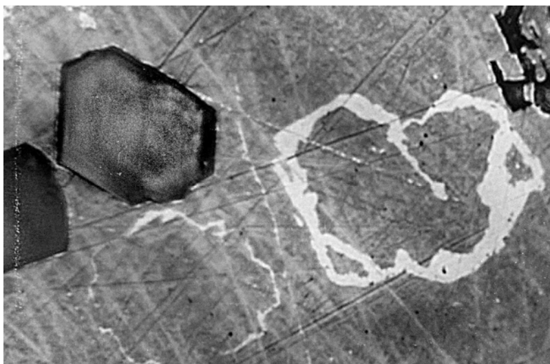
Рисунок 4 – Джезказганит и метакристаллы позднего кварца в борните. Аншлиф, отраженный свет. Ув. 1500, иммерсия