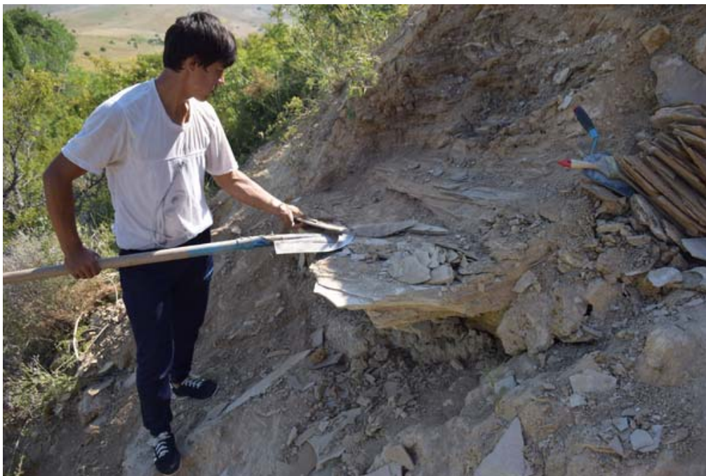
Рисунок 3 – «Бумажные» сланцы местонахождения Аулие