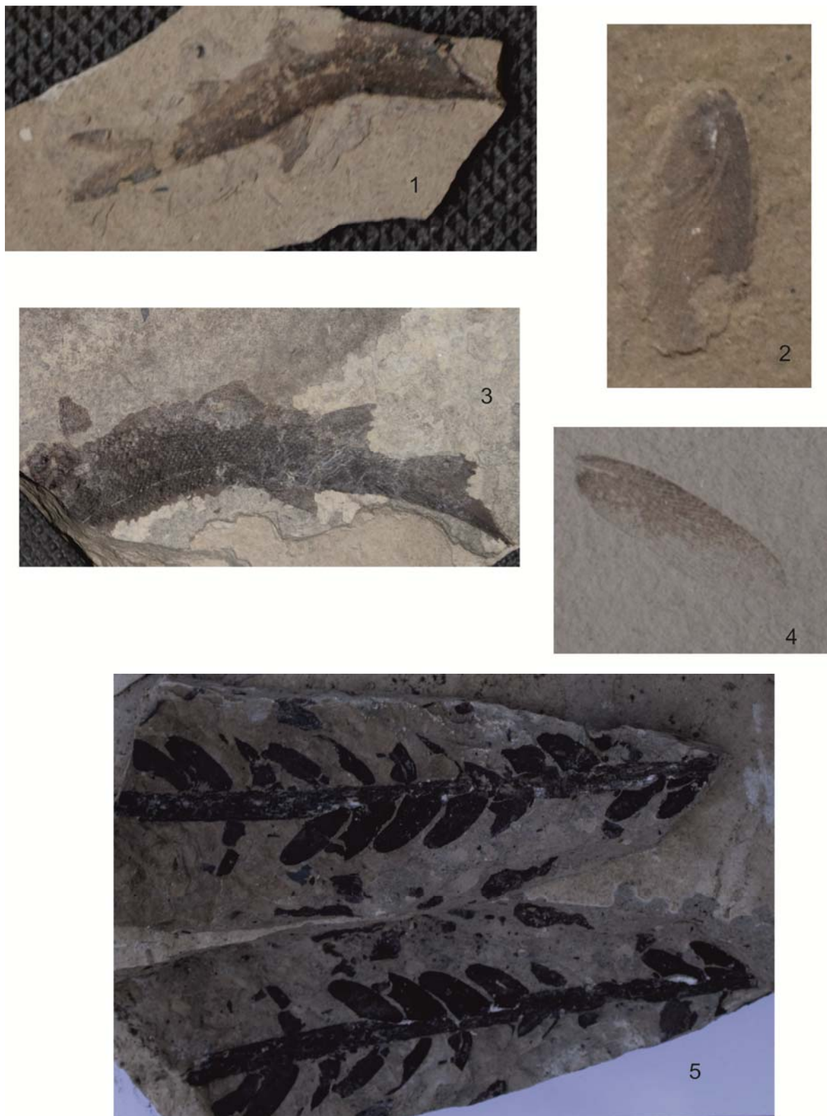
1, 3 – фрагменты рыб, 2 – фрагмент крыла цикады ( Cicadidae ); 4 – фрагмент крыла насекомого (цикада или стрекоза); 5 – Cladophlebis whitniensis (Brongniard) var. punctata Brick.

Рисунок 5 – Отпечатки, собранные летом 2016 г.