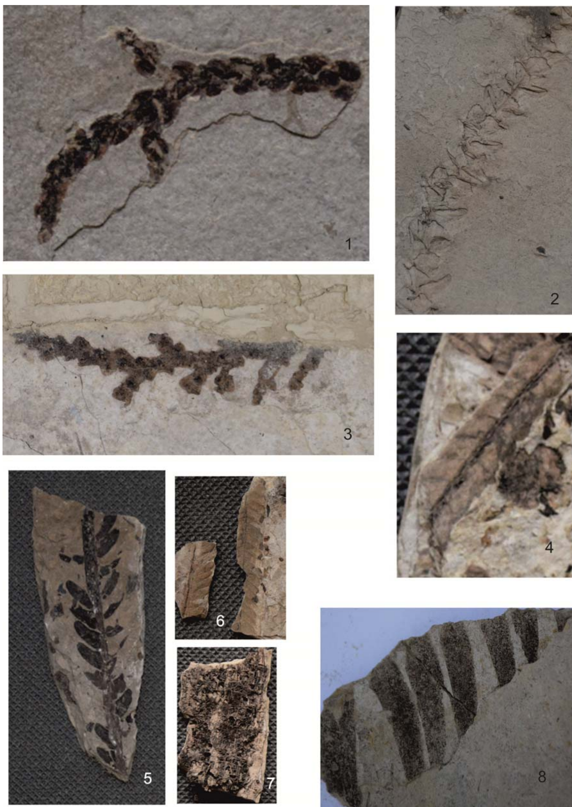
1-3 – Pagiophyllum papillatum Orlovskaya; 4, 6 – Ptilophyllum caucasicum Dolud. Et Svan.; 5 – Cladophlebis whitniensis (Brongniard) var. punctate Brick; 7 – фрагмент корневища; 8 – Otosamites giganteus Thomos.

Рисунок 4 – Фрагменты отпечатков побегов, собранные летом 2016 г.