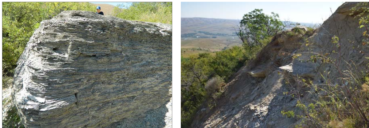
Рисунок 6 – Вид на обнажение сланцев с отпечатками органики в 2014 г. и в 2016 г.