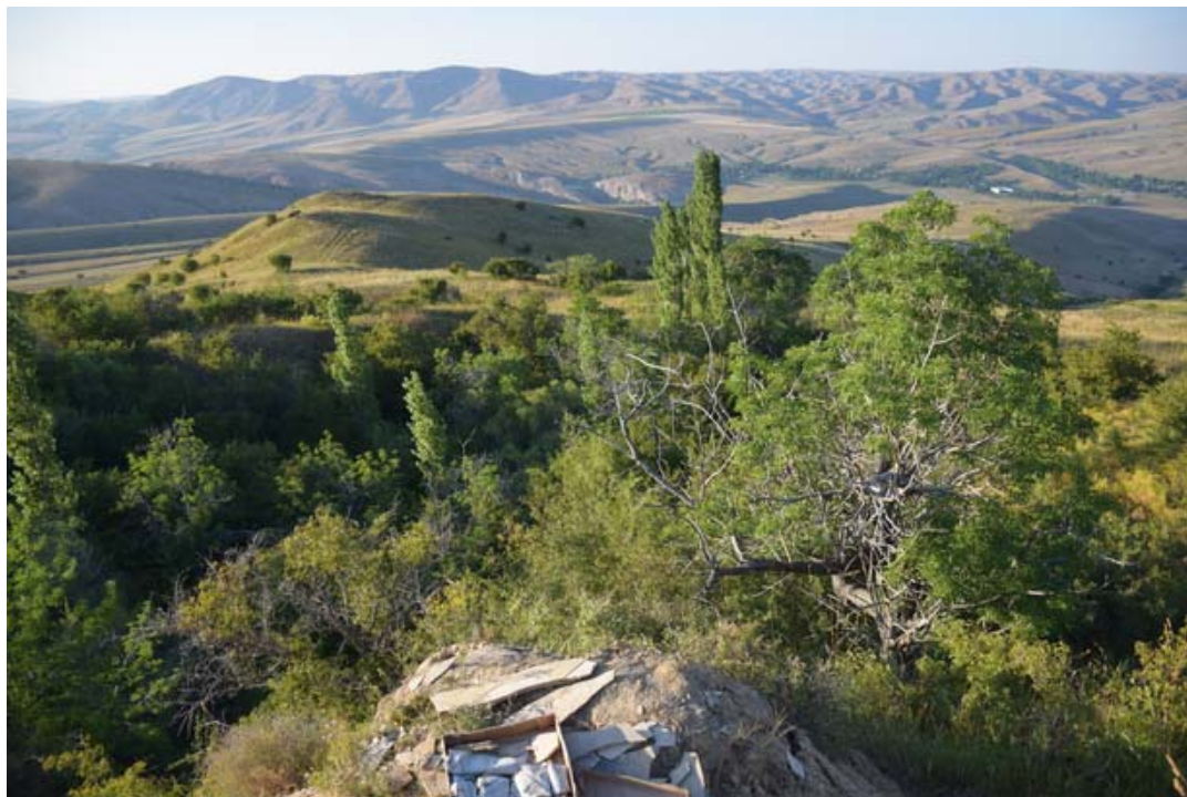
Рисунок 1 – Общий вид на обнажение Аулие на левом берегу реки Кошкарты