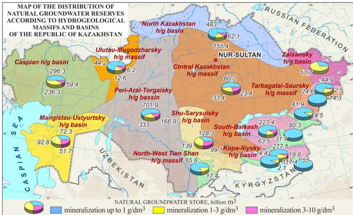
Figure 2 – Map of natural groundwater reserves distribution across hydrogeological massifs and basins of the plain territory of the Republic of Kazakhstan

Computer models of the maps of natural groundwater reserves distribution across hydrogeological massifs and basins of the plain territory of the Republic of Kazakhstan. According to the completed hydrogeological zoning based on the geological and structural principle, hydrogeological structures are divided into two main categories of structures - hydrogeological massifs and hydrogeological basins which are represented as the main units of hydrogeological zoning of the first order [15,16]. Natural groundwater reserves distribution across hydrogeological massifs and basins of the plain territory of the Republic of Kazakhstan is reflected on a corresponding map of the information system (figure 2).